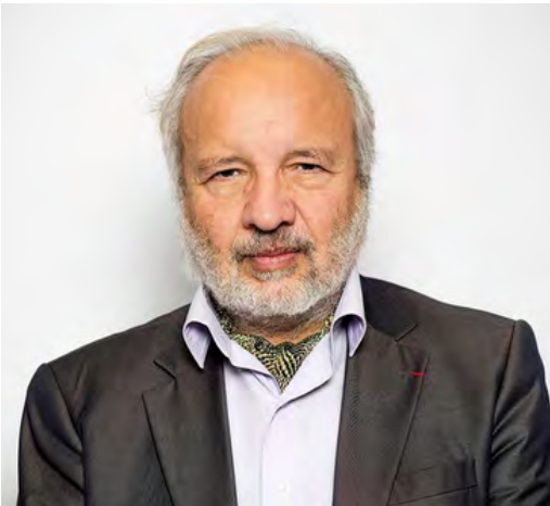
Henry Laurens, titulaire de la chaire d'Histoire contemporaine du monde arabe au Collège de France